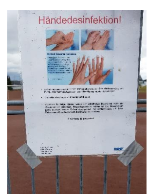
Abbildungen Hygienemaßnahmen TSV Großen Linden